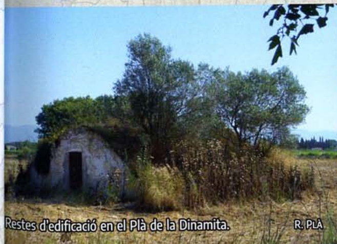
Restes d'edificació en el Pla de la Dinamita.

RECURSOS: https://ja.cat/ruta312 https://ja.cat/campaviacio