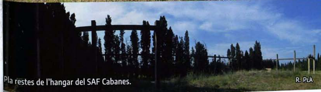
Pla restes de l'hangar del SAF Cabanes.