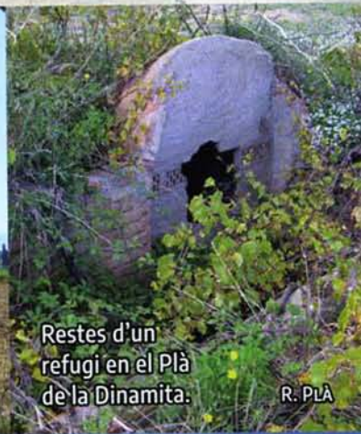
Restes d'un refugi en el Pla de la Dinamita.